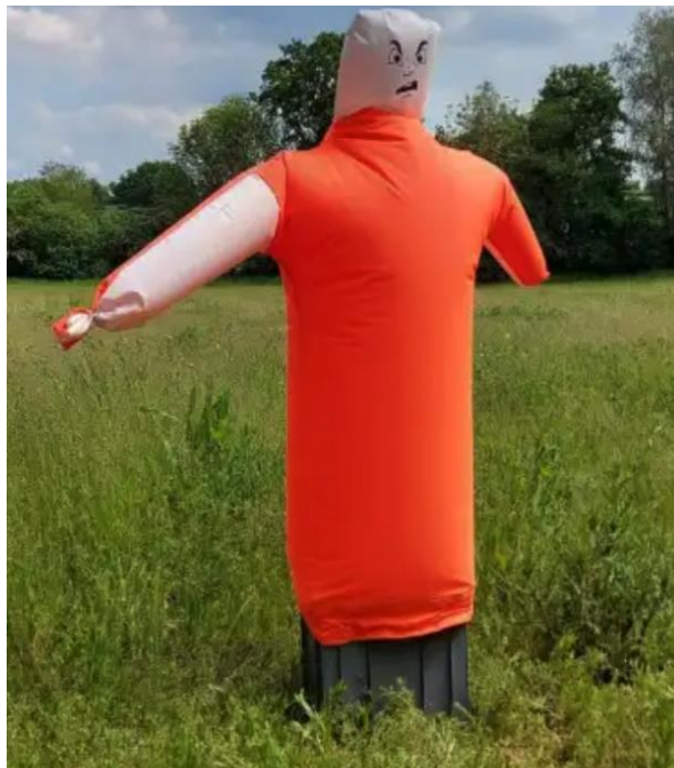
Kuva. Scare-man ilmalla täyttyvä linnunpelätin

Keväällä kun merimetsot saapuvat alueelle estettiin uusien yhdyskuntien syntyminen. Merimetsojen torjunnassa keväällä on avainasemassa tehokas pesintäyhtyritysten tarkkailu. Pesä syntyy linnuilta nopeasti ja munapesän poistaminen oli lupaehdoissa kielletty. Pesät, joihin ei oltu ehtiä munia, poistettiin. Useimmissa tapauksissa riitti pesintää suunnittelevien merimetsojen häirintä ja paikalle jätetty karkotin tai pelotin. Jo rakennettujen pesien poistamiseen jouduttiin turvautumaan Taivassalon edustalla sekä Kaitaisten salmessa. Kohteeseen jätetty linnunpelätti (haalarimies, scaery-man) sekä lähettävä riistakamera ehkäisi uusintapesintäyhtyritykset ja tilannetta seurattiin etänä. Linnunpelättimistä valtaosa saatiin lahjoituksena tekijältä Uudenkaupungin kaupungintalon edustalta puretusta taideteoksesta missä oli noin 100 erilaista ihmishahmoa. Hankeaikana alueelle ei syntynyt yhtään uutta merimetsoyhdyskuntaa. Lisäksi alueen tuntumassa ollut Tiiraleton yhdyskunta hävisi ilmeisesti merikotkan ansiosta.