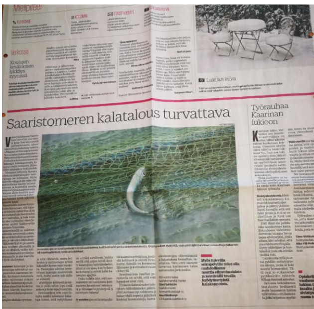
KUVA 5. ELINKEINON KANNANOTTO SAARISTOMEREN KALATALOUDEN PUOLESTA TURUN SANOMIEN MIELIPIDEPALSTALLA 9.2.2018

Kananoton vaikutus ei ole mitattavissa, mutta laajasta näkyvyydestä johtuen on perusteltua olettaa, että hankkeen vaikutuksesta päättäjät ottavat huomioon elinkeinokalatalouden ahdingon päätöksissään ja että kuluttajat tekevät yhtä tietoisempia kalavalintoja kaupassa.