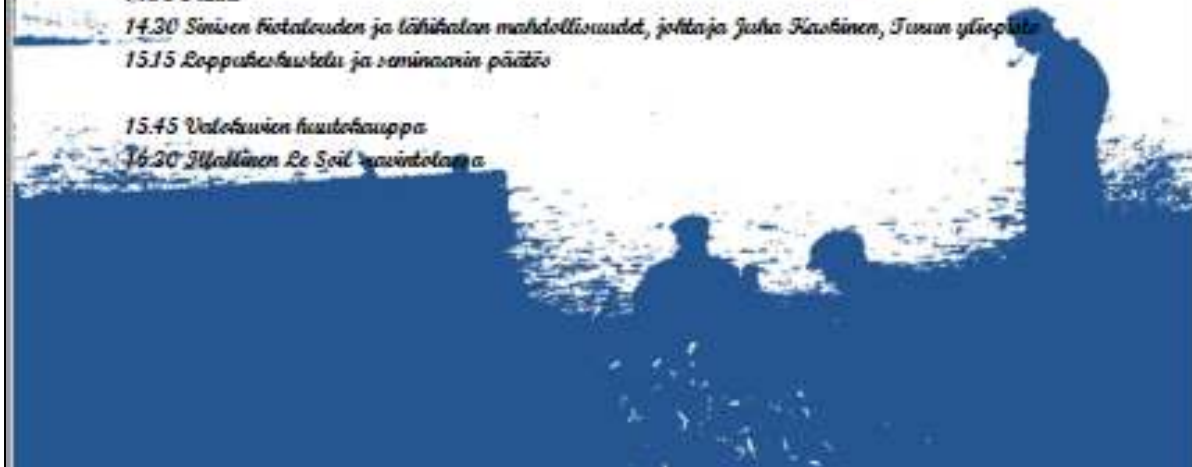
KUVA 2. KUTSU JUHLASEMINAARIN KUNNIAVIERAILLE