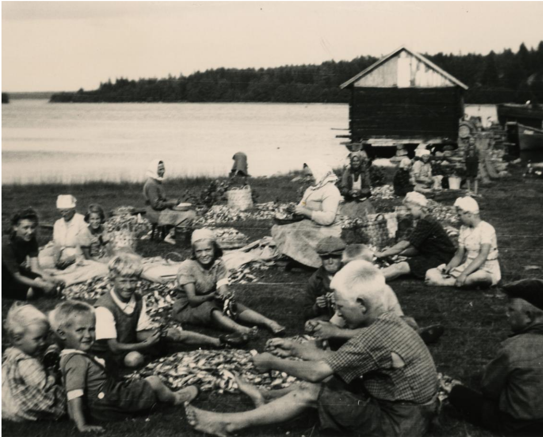
KUVA 1. E. VUORELAN VALOKUVA PYHÄMAALTA 1939.

Loppuraportti Anu Niinikorpi L-S Kalatalouskeskus ry 31.1.2018