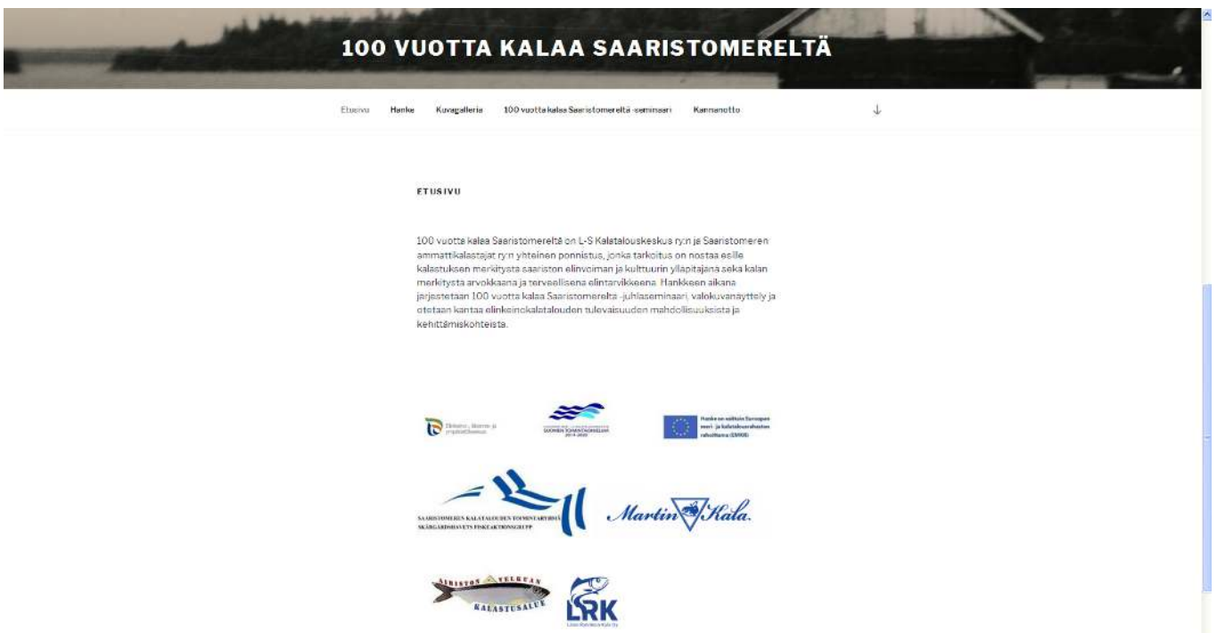
KUVA 4. KUVAKAAPPAUS 100 VUOTTA KALAA -INTERNET-SIVUSTA

Hankkeelle perustettiin Internet-sivut. Niiden laatimiseksi ja ylläpitämiseksi pyydettiin tarjoukset neljältä eri yrittäjältä ja tekijäksi valittiin halvimman tarjouksen perusteella Dempore Oy. Sivustolle lisättiin valokuvagalleria, tietoa hankkeesta, hankkeeseen liittyvät lehdistötiedotteet, hankkeen aikana laadittu elinkeinon kannanotto Saaristomeren kalatalouden puolesta, osa juhlaseminaarin esityksistä sekä hankkeen loppuraportti. Internet-sivujen ylläpitosopimus on tehty vuoden 2018 loppuun. Kuvakaappaus sivuston etusivulta kuvassa 4.