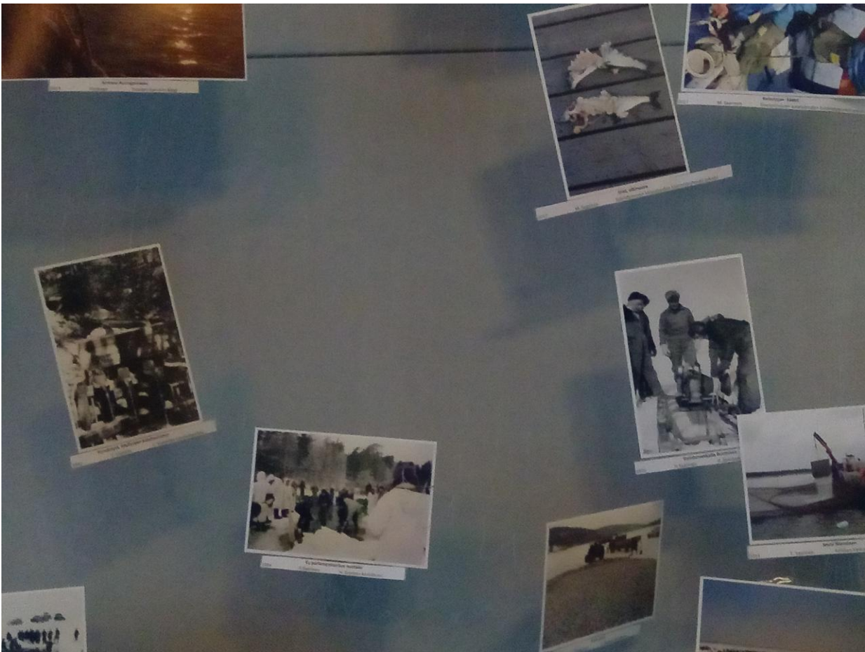
KUVA 3. VALOKUVANÄYTTELYN KUVIA.

Juhlaseminaarin yhteyteen rakennettiin valokuvanäyttely, jossa oli 50 valokuvaa. Osa kuvista ripustettiin kalaverkkoon esille (kuva 3) ja osa kehystettiin huutokaupattavaksi juhlaseminaarin päätteeksi. Kuvista vanhin oli vuodelta 1939 ja uusin vuodelta 2017. Valokuvien aiheen käsittelivät monipuolisesti ammattikalastusta, kalankasvatusta ja kalatalousneuvontaa. Lista valokuvista raportin liitteenä (liite 4). Kaikki valokuvat myös digitoitiin ja lisättiin hankkeen Internet-sivuille osoitteessa www.100vuottakalaa.fi . Valokuvia kerättiin yksityishenkilöiden ja eri yhteisöjen valokuva-arkistoista.